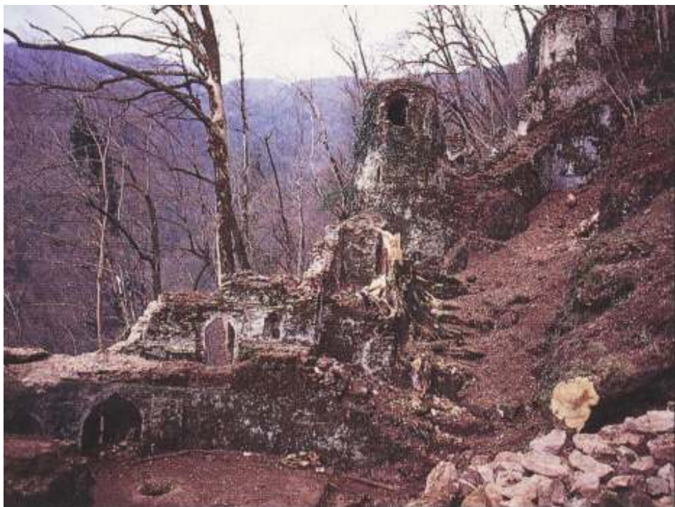
شکل شماره ۳- نمای جنگلی