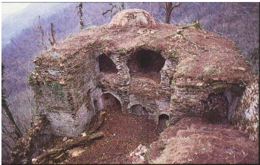
شکل شماره ۲- نمایی از قلعه

این قلعه دارای در ورودی با پایه ستونی از سنگ سفید به ابعاد ۳۵ \times ۷۷ \times ۲۵ سانتی‌متر بوده است و کتیبه ذیل روی آن نوشته شده بود که توسط فردی هندی از جا کنده شده و از بین برده شده است. روی آن عبارات زیر نوشته شده بود. «علاءالدین اسحق خلد ملکه و سلطانه در تاریخ ثمان عشر و تسمعایه این قلعه مبارکه را که مسمی به قلعه حسامی است و هرگز درجه تغییر نیافته ... ۹۱۸ دانا چون دهر دشمن خوی هرزه جوی ... خویش اظهار کند و عهد ... باقی مطالب آن فرسوده شده و از میان رفته است» ۸ .